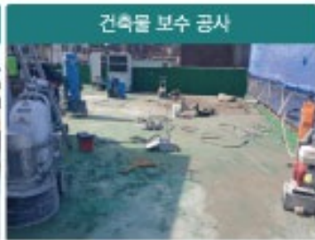
건축물 보수 공사