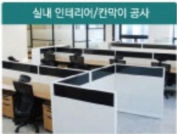
실내 인테리어/칸막이 공사