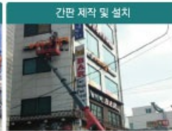
간판 제작 및 설치