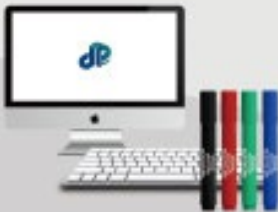
사무용품 / 컴퓨터

주문자별 구매 내역 제공 결제 방식의 다양화 공공구매실적 반영 찾아가는 렌탈 / 사후관리 서비스