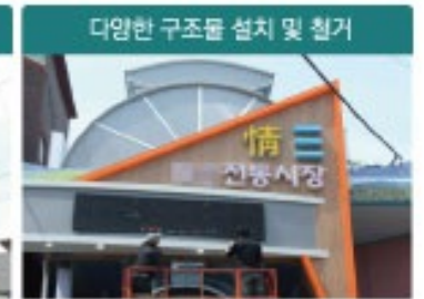
다양한 구조물 설치 및 철거